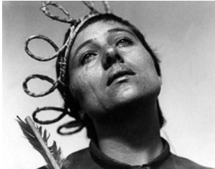
Die Passion der Jungfrau von Orléans (Frankreich 1928)

Als Vorbild für die visuelle Gestaltung von Ida nennt Regisseur Pawel Pawlikowski selbst die Filme von Carl Theodor Dreyer. Die Filme des dänischen Filmpioniers sind von Spiritualität durchdrungen, schildern den Menschen auf seiner Suche nach göttlichem Sinn, aber auch religiösen Wahn. Zwei Filme stehen dafür exemplarisch: In seinem Stummfilm Die Passion der Jungfrau von Orléans ( La passion de Jeanne d'Arc , Frankreich 1928) zeigt er das Martyrium der Heiligen in expressionistischen Großaufnahmen, als horrorartiges Seelengewitter. Mit dem Kreuz in der Hand geht die dornengekrönte Johanna den