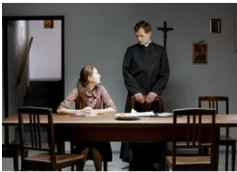
Kreuzweg (Deutschland 2014)

In einer Zeit religiöser Zwanglosigkeit und schwindendem gesellschaftlichem Einfluss der Kirchen erscheint es zunächst erstaunlich, dass explizit Religion thematisierende Filme wie Kreuzweg (Dietrich Brüggemann, Deutschland 2014), Paradies: Glaube (Ulrich Seidl, Österreich 2013) und Die Nonne (La religieuse, Guillaume Nicloux, Frankreich/Belgien 2013) eine Renaissance erfahren. Während diese jedoch die restriktive und lebensfeindliche Seite einer fundamentalistisch erscheinenden Konfession zeigen, steht Ida eher in der Tradition solcher Filme, die Religion als